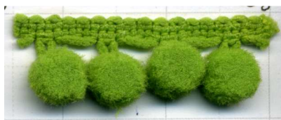
COL. 28 - PISTACHO