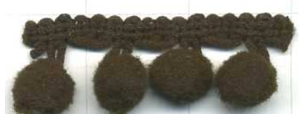
COL. 33 MARRON CHOCOLATE