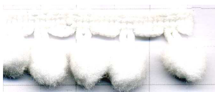
COL. 1 - BLANCO