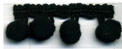
COL. 35 - NEGRO