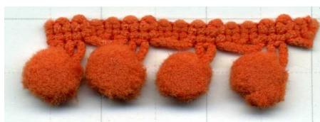
COL. 7 - CORAL