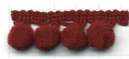
COL. 22 - BURDEOS