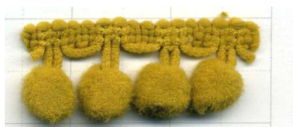
COL. 9 - ORO