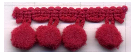
COL. 95 - FUXIA