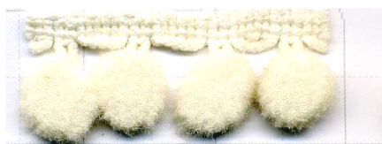
COL. 102 - CRUDO